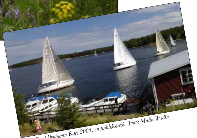
Populära Ulvöhamn Race 2005, en publiksuccé.

Turistinformation, servicehus, bänkar, bord och blomlådor. Det är exempel på resultat i det EU-projekt som drivits och som UKL aktivt deltagit i. Projektet innefattar även en ny lekpark samt tv-reklam. Lekparken kommer att färdigställas under våren och reklamerna rulla i tv 4.