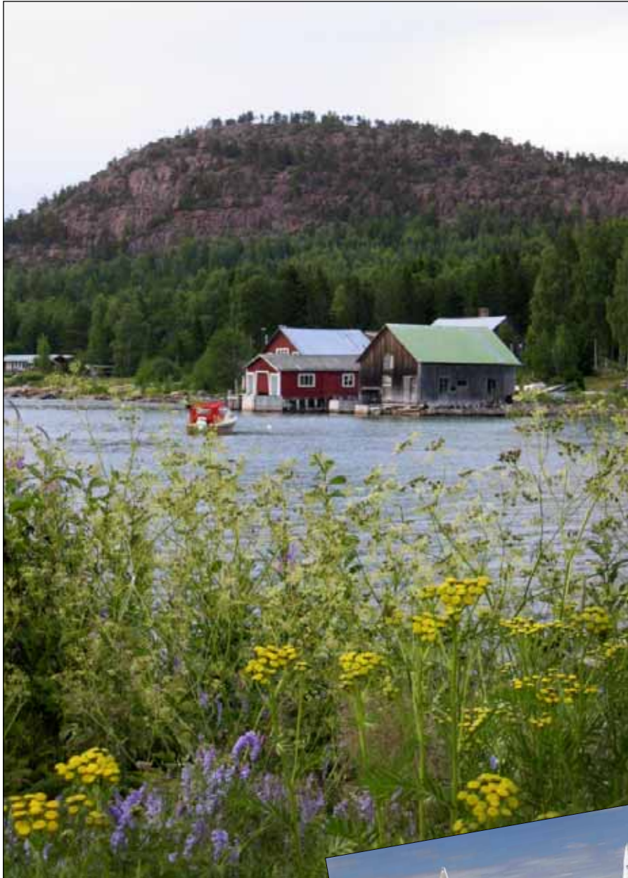
Fjären. Sommarkväll vid färjeläget.

Därför vill vi uppmana alla medlemmar på Fjären, i och kring Norrbyn och Sörbyn att komma med förslag till åtgärder, projekt med mera gällande områden utanför Ulvöhamn. Hör av er. Det finns inga dumma idéer!