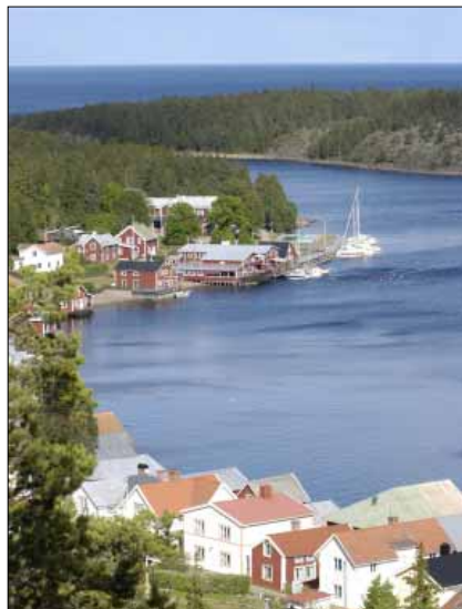
Utsikt från Lotsstugan och Lotsberget midsommarafton 2005.